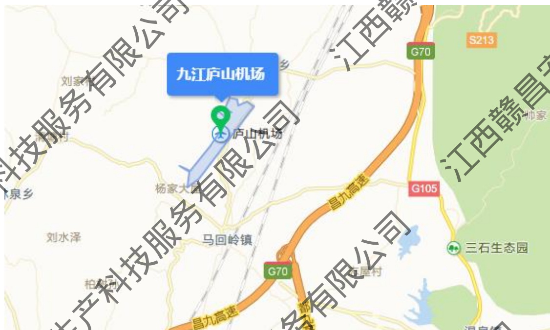
图 4.2.1-1 地理位置图